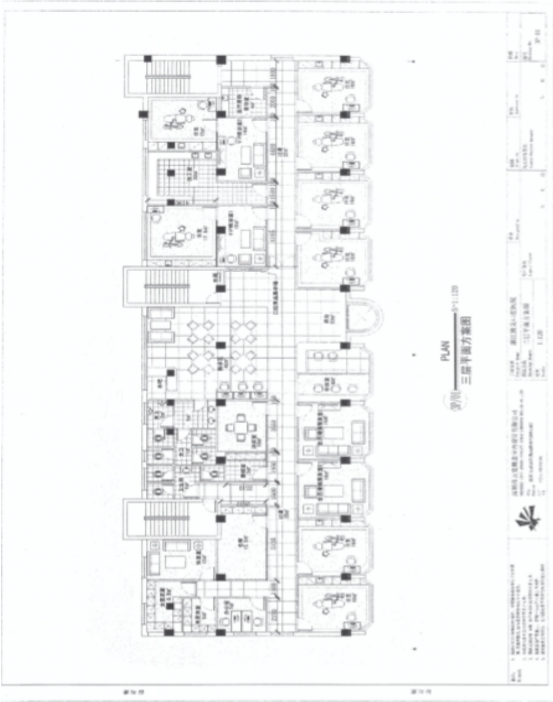
PLAN 三層平面方案图 1:120