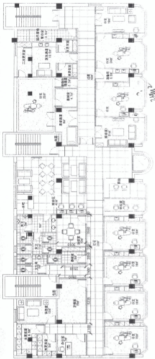
PLAN 四層平面方案圖 5:1:120