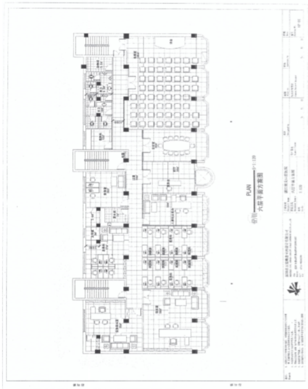
图2 生产厂区总平面布置图