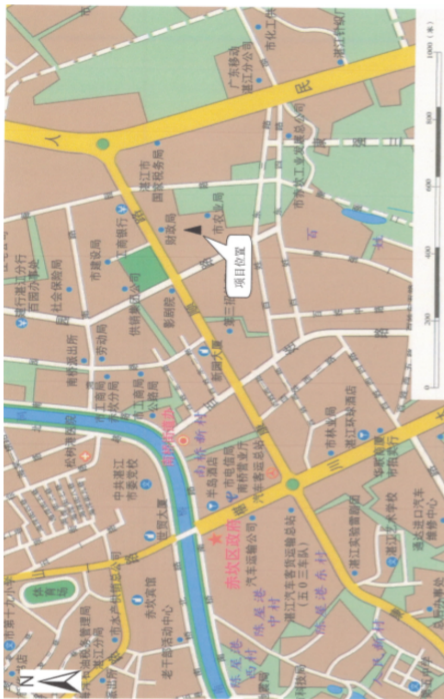
附图 1 项目位置图